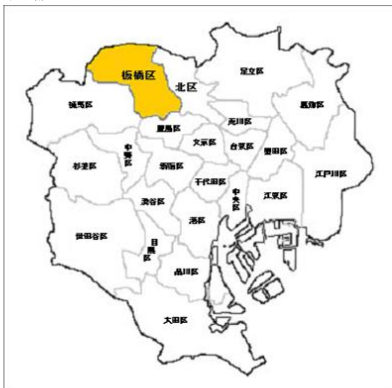
東京都 23 区の地図